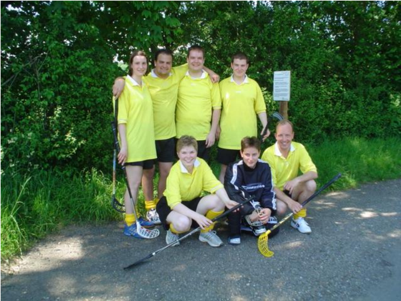
ESK Biel Mixed 3