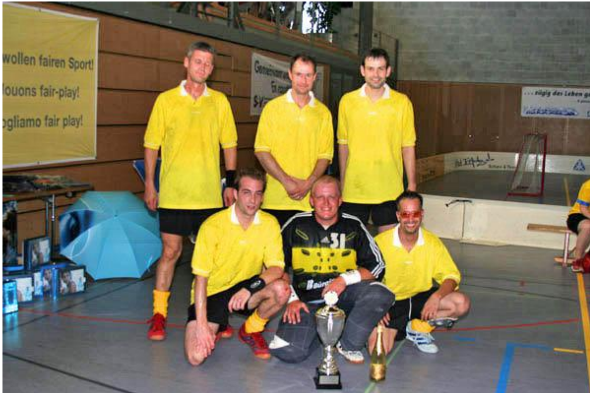
Titelverteidiger ESK Biel 1

Was bisher noch keinem Team gelungen ist, wurde an der Schweizermeisterschaft 2005 Tatsache: Unser 1 hat in Kloten erfolgreich den Titel verteidigt. In einem packenden Final konnte wie schon im Vorjahr ESV Rätia 7 bezwungen werden.